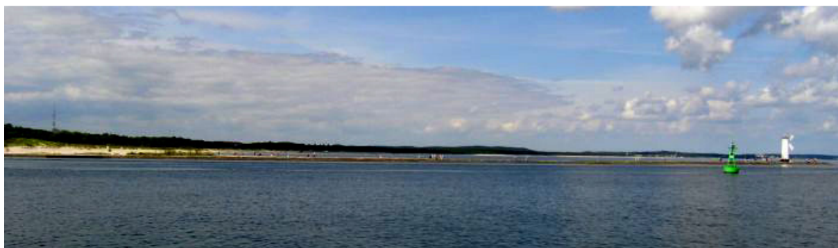
Die Einfahrt nach Swinoujcie

Und was für ein Kurs, mit 132° sind wir genau auf Vorwindkurs, können sogar die Genua ausbaumen und sind damit bei 4 - 5 Bft. ausgesprochen schnell unterwegs. Usedom zieht an uns vorbei, Zinnowitz, Lüttenort, ungefähr hier überholen wir einen Traditionssegler, auf den wir langsam aufgelaufen sind. Dann Bansin, Heringsdorf, Ahlbeck und wir stehen vor der Einfahrt nach Swinoujcie.