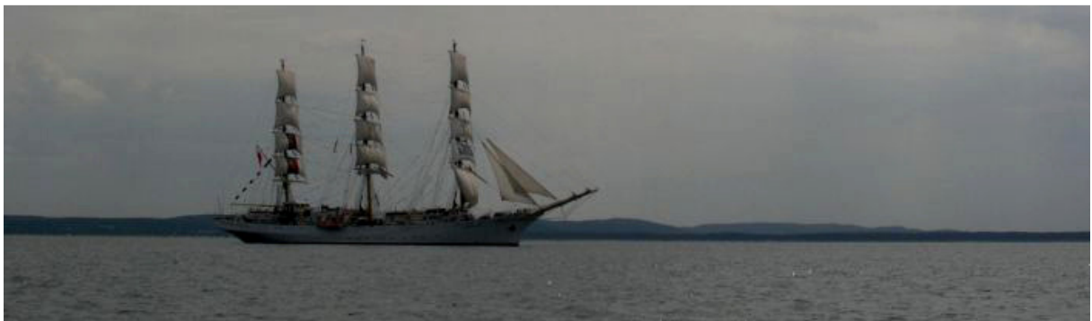
Immer wieder Begegnungen mit unbekanntem Großseglern

Heute ist endlich Sommer, das Thermometer klettert bereits um 1000 auf knapp 20°, dazu blauer Himmel, Sonnenschein und vielleicht kommt der Winddreher erst so spät, dass wir Dziwnow ohne Kreuzkurs erreichen ..? Denkste! Als wir ablegen legen sich erste Wolkenfelder vor die Sonne und draußen kommt uns der Wind bereits entgegen, wir müssen kreuzen. Genau das wollten wir ja nicht, aber rückwärts betrachtet empfinden wir es schon als Glück, dass wir drei Tage hintereinander unseren Kurs segeln konnten, also was soll's.