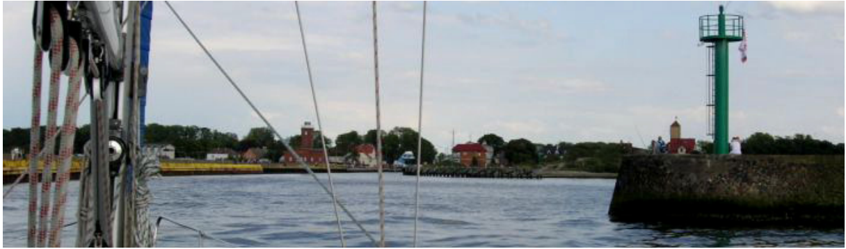
Die Hafeneinfahrt von Darlowo.

... kurz vor Darlowo packen wir die kurzen Hosen wieder aus und machen bei schönsten Wetter vor dem Gebäude des Bosman Portu (Hafenkapitän) fest. Hier muss man sich anmelden und erhält den Schlüssel fürs Sanitärgebäude.