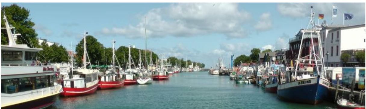
Warnemünde am alten Strom