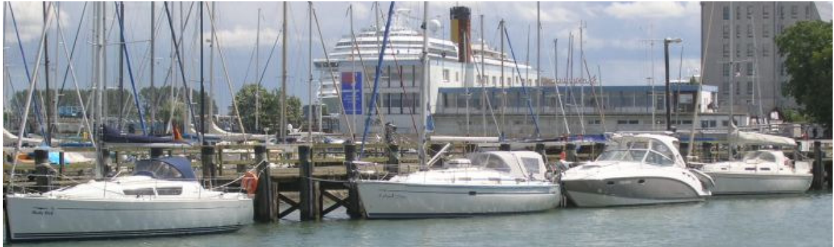
"Kalami Star" an der Mittelmole in Warnemünde

Brötchen aus dem "Lila Café", schmieren uns Brote für die lange Fahrt, Tee wird gekocht, aber als ich die Kuchenbude verstaue und sehe, dass der Wind weiter zunimmt, entscheide ich mich gegen die Abreise. Der Windmesser zeigt bereits im Hafen 6 Bft., dann werden es draußen ganz bestimmt 7, in Böen sicher 8 Bft. sein. Das alles bei maximaler Wellenhöhe, die in diesem Teil der Ostsee bei Westwind durchaus 3 - 3,5 m hoch ausfallen kann. Nein, Sicherheit geht nun einmal vor, wir bleiben.