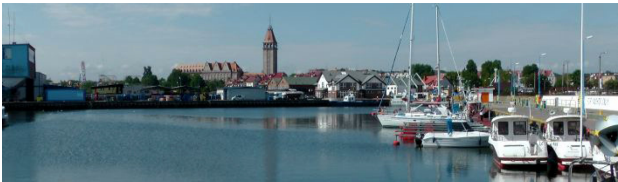
Wladylawowo sieht am Tage ganz anders aus

Aber was ist das hier für ein Hafen? Für die Yachten wurde 10 Plätze an Schwimmstegen eingerichtet. Wasser und Strom, so weit alles prima. Der Hafenmeister kassiert auch so spät noch am Steg und dann kommt auch noch der Zoll und fragt die bereits bekannten Daten ab: Schiffsname, wie viel Personen an Bord, woher, wohin? Der Zugang zu Duschen (7 St.) und Toiletten (2 St.) führt über einen Wachmann, der nach Zahlung der Gebühr die Räume aufschließt. Das ist insbesondere für die Frauen am späten Abend nicht unbedingt angenehm. Als dann auch noch ein paar Jugendliche in der Dunkelheit mit Pitbull über den Steg flanieren, machen wir uns schon ein paar Sorgen, aber das ist eher dem langen Törn und der Nachtsituation geschuldet, am Tage sieht das wieder anders aus.